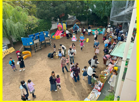
↑↑↑チャリティバザーの様子