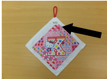
お手拭きタオル （30 cm×30 cm位のもの）