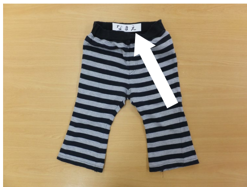
ズボン(半・長) 又はスカート 2枚

ジーンズ系やつなぎ類、硬い生地 のものは避けましょう。スカート着 用の場合は、スパッツや短パンを中 に履きましょう。すその長いものは ●●内側に縫いあげましょう。