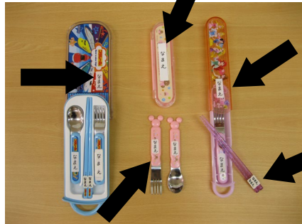
ケース付きフォーク・スプーン 又は箸