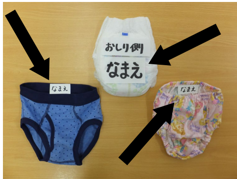
布パンツ 2枚 紙パンツ1枚(緊急用)