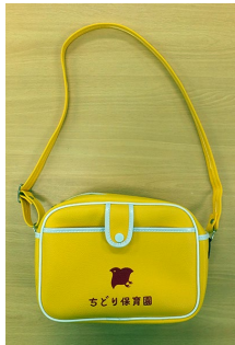
通園カバン カバンには“何も”（以上児用れんらくノート入り） つけないで下さい。

レンタル物品 — ふきとり布、タオルを使用する場合（お漏らしや泥汚れなど）があります。（月末に費用を徴収させていただきます） （持ち物には全部写真と同じところにひらがなで名前を書きましょう）