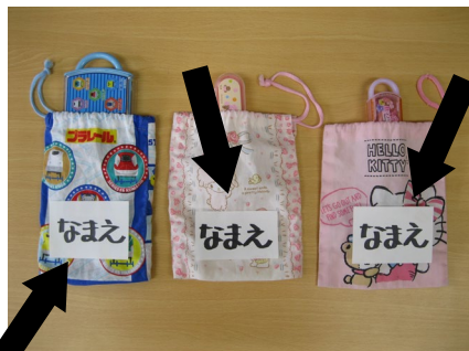
フォーク・箸用袋