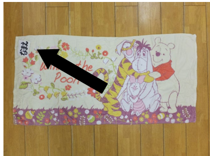
バスタオル1枚 （縦120 cm×横60 cm位のもの） ※お持ち頂く日は後日お知らせします。