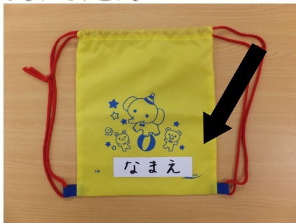
汚れ物入れバッグ 毎週末、必ず洗いましょう