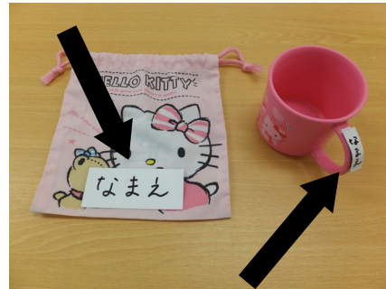
コップとコップ袋