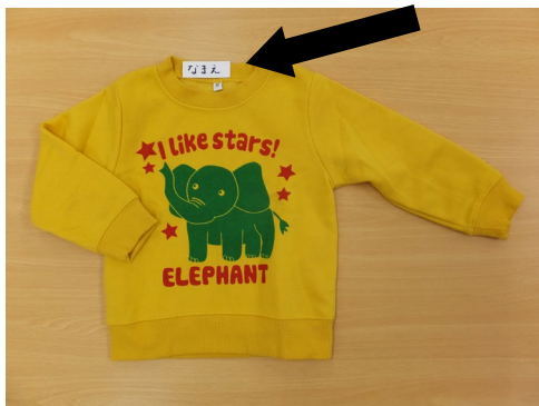
上着(トレーナー、Tシャツ) 2枚 ボタン類が少なく、フード付きでない物