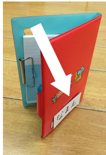
おたよりファイル