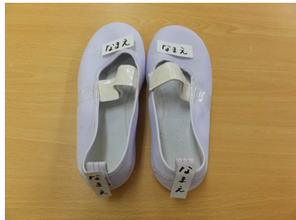
うわばき1足 ※きく・さくら組のみ